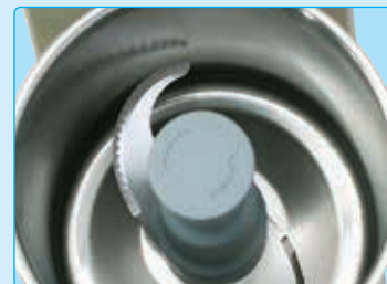
Vasca in acciaio inox