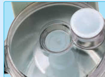
Coperchio trasparente K35